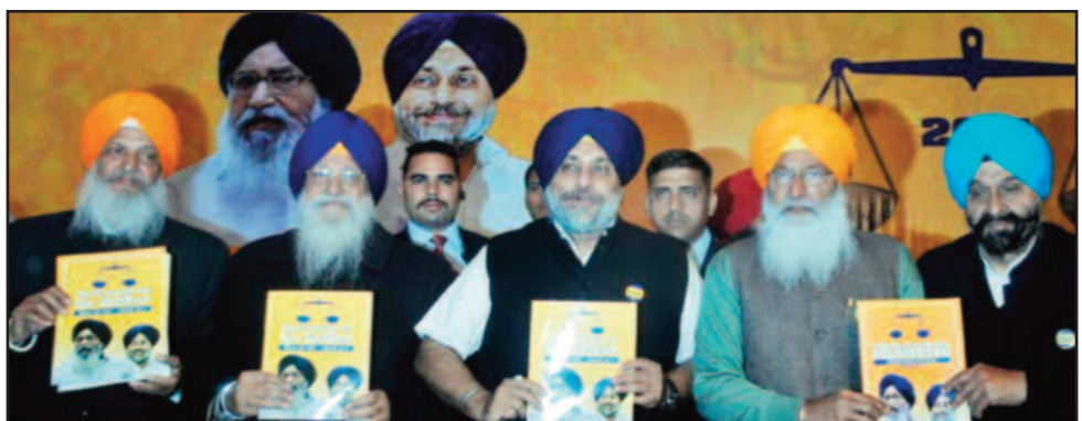
ਆਗੂ ਵੀ ਹਾਜ਼ਰ ਸਨ।