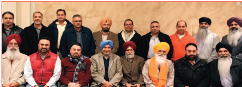
ਇਸ ਫੰਡ-ਰੋਜ਼ਰ ਪ੍ਰੋਗਰਾਮ ਦੌਰਾਨ ਆਮ ਲੋਕਲ ਪੰਜਾਬੀਆ ਦਾ ਹੁੰਗਾਰਾ ਬੇਮਿਸਾਲ ਰਿਹਾ ਅਤੇ ਇਸ ਫੰਡਰੋਜ਼ਰ ਦੌਰਾਨ

ਇਸੇ ਕੜੀ ਤਹਿਤ ਆਖਰੀ ਹੱਲੇ ਦੇ ਤੌਰ ਤੇ ਬਹੁਤ ਸਾਰੇ ਪ੍ਰਵਾਸੀ ਪੰਜਾਬੀ ਆਪ ਪਾਰਟੀ ਦੇ ਪ੍ਰਚਾਰ ਲਈ ਪੰਜਾਬ ਵੱਲ ਨੂੰ ਕੂਚ ਕਰ ਗਏ ਹਨ, ਬਾਕੀ ਬਚਦੇ ਕਾਲਿੰਗ ਕੈਂਪੇਨ ਜ਼ਰੀਏ ਲੋਕਾਂ ਨੂੰ ਜਗਾ ਰਹੇ ਹਨ। ਆਰਥਿਕ ਪੱਖੋਂ ਪਾਰਟੀ ਦੀ ਮੱਦਦ ਲਈ ਐਨ ਆਰ ਆਈ ਵੀਰ ਫੰਡ ਵੀ ਇਕੱਤਰ ਕਰ ਰਹੇ ਹਨ, ਇਸੇ ਸੰਦਰਭ ਵਿੱਚ ਇੱਕ ਪ੍ਰਭਾਵਸ਼ਾਲੀ ਸਾਦਾ ਸਮਾਗਮ ਫਰਿਜ਼ਨੋ ਆਪ ਇਕਾਈ ਵੱਲੋਂ ਸਥਾਨਿਕ ਇੰਡੀਆ ਓਵਨ ਰੈਸਟੋਰੈਂਟ ਵਿੱਚ ਰੱਖਿਆ ਗਿਆ।