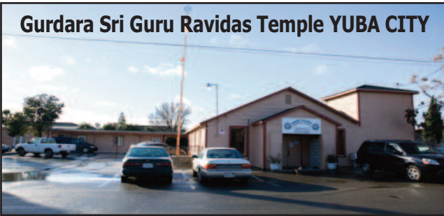
Gurdara Sri Guru Ravidas Temple YUBA CITY