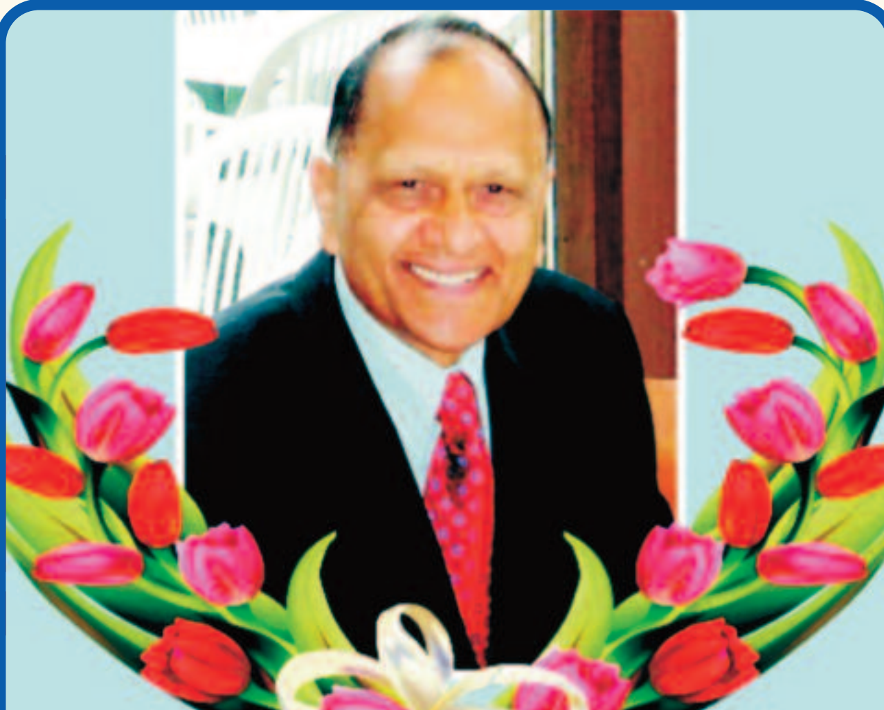
Late Commissioner Lahori Ram Ji