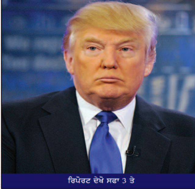
ਰਿਪੋਰਟ ਦੇਖੋ ਸਫਾ 3 ਤੇ